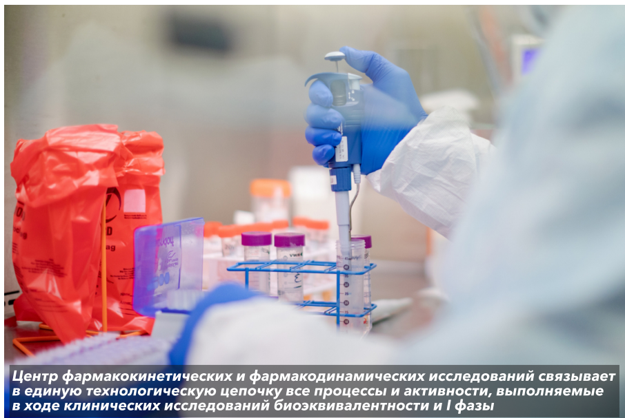
Центр фармакокинетических и фармакодинамических исследований связывает в единую технологическую цепочку все процессы и активности, выполняемые в ходе клинических исследований биоэквивалентности и I фазы

Химико-аналитическая лаборатория QBioLab появилась в структуре НИЦ в прошлом году, и первый год работы доказал ее своевременность и востребованность. Напомним, основная задача лаборатории – проведение работ по исследованию параметров фармакокинетики лекарственных препаратов в соответствии со стандартами надлежащей лабораторной и клинической практики (GCP и GLP). В