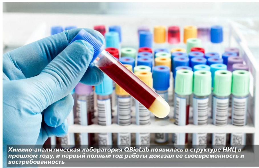
Химико-аналитическая лаборатория QBioLab появилась в структуре НИЦ в прошлом году, и первый полный год работы доказал ее своевременность и востребованность

Все перемены, произошедшие в НИЦ в 2022 году, безусловно, к лучшему. И в очередной раз укрепляют позиции Центра на российском рынке клинических исследований лекарственных препаратов.