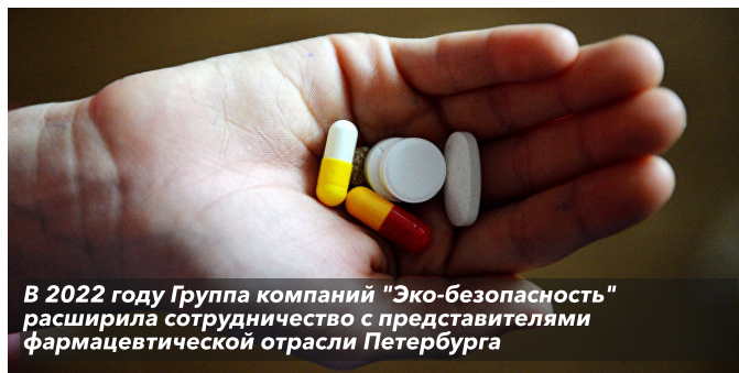
В 2022 году Группа компаний «Эко-безопасность» расширила сотрудничество с представителями фармацевтической отрасли Петербурга

В свою очередь здравпункт «Биокад» в сентябре пополнился еще одним кабинетом. «Там мы открыли кабинет предрейсового осмотра. Это стало логичным дополнени-